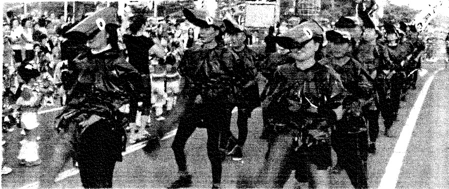
〔昨年参加した写真です〕